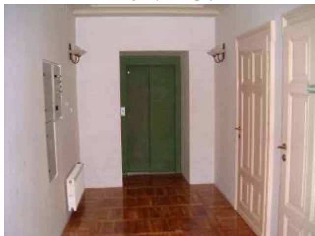
korytarz I piętrze