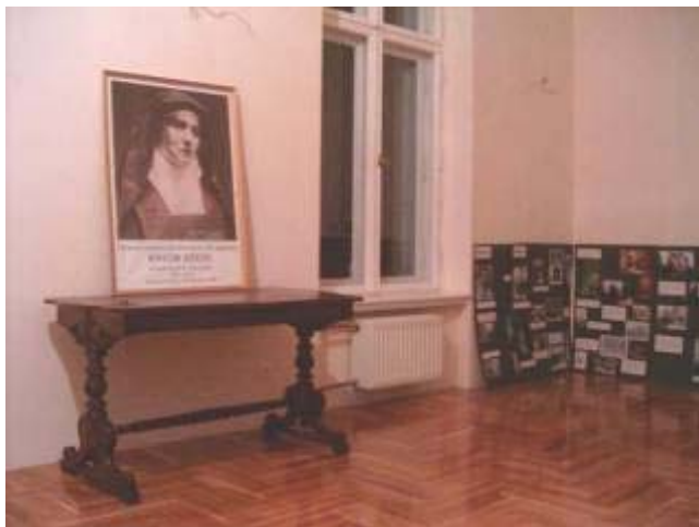
Sala Augusty na I piętrze